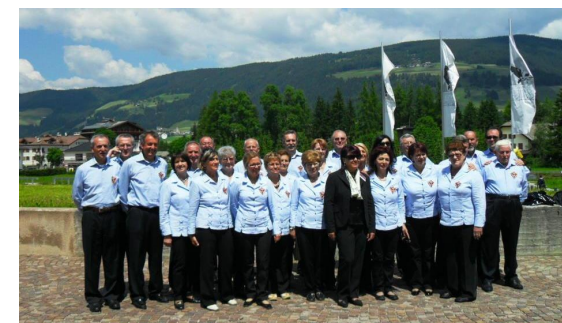
Coro San Leopoldo