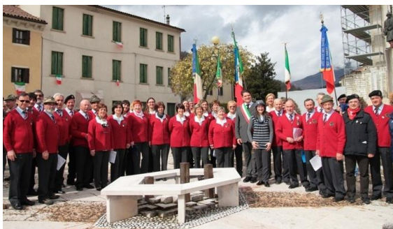
Corale dei Laghi