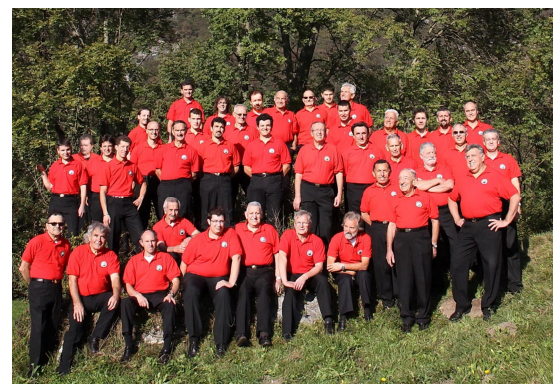
Coro Monti del Sole